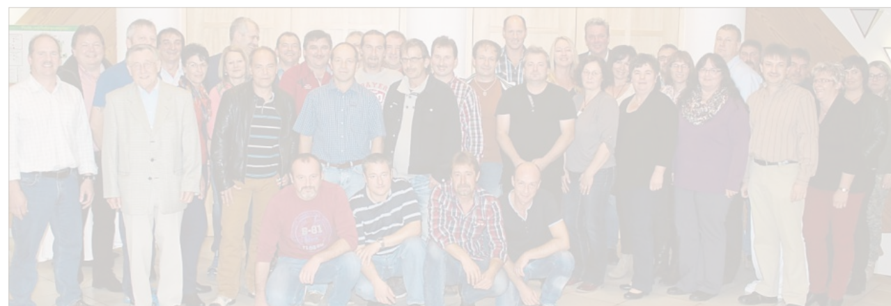
Bereits das dritte Mal traf sich der Abschlussjahrgang 1984 der Volksschule Roding.

„Schon mit der Teilnahme haben Sie bewiesen, dass Sie sich etwas zutrauen und für Ihr Handwerk brennen“, sagte Hettmann. Er sei davon überzeugt, dass die jungen Talente den Erfolg des Handwerks weiter vorantreiben werden.